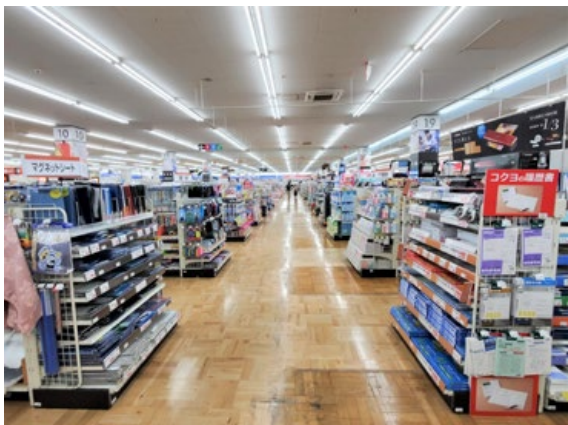
広々とした通路を確保

また、2階の生活館にはインテリア用品、カーテン売場を移設。日用品、家庭用品、事務店舗用品、インテリア・カーテン、インテリア用品、カーテン、家電等一般向けの商品群を展開します。