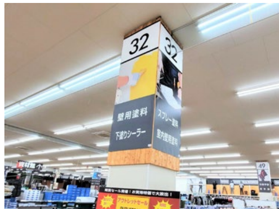
商品を探しやすいようにサインを売り場ごとに設置