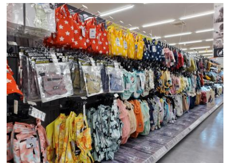
ペット用衣料売場