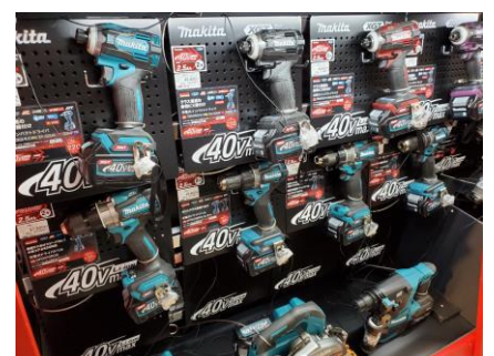
プロ御用達の有名メーカー多数：工具売場