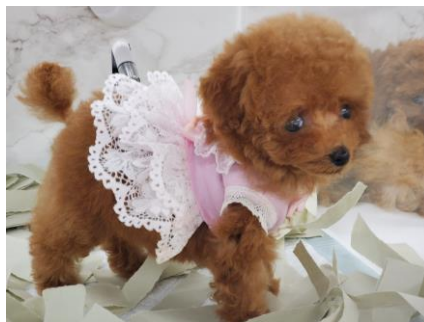
ペット生体イメージ