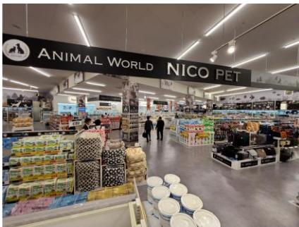
NICO PET 外観

また、毎日使う消耗品、フードをはじめ、お手入れ用品、犬具、衣料、ペットハウスなどペットとの暮らしに必要な商品は 9,000 点以上の取り扱いをいたします。